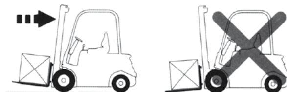
ERRATA INCLINAZIONE DEL MONTANTE