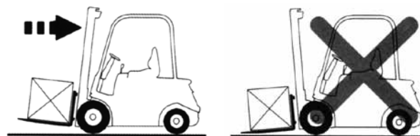
ERRATA INCLINAZIONE DEL MONTANTE